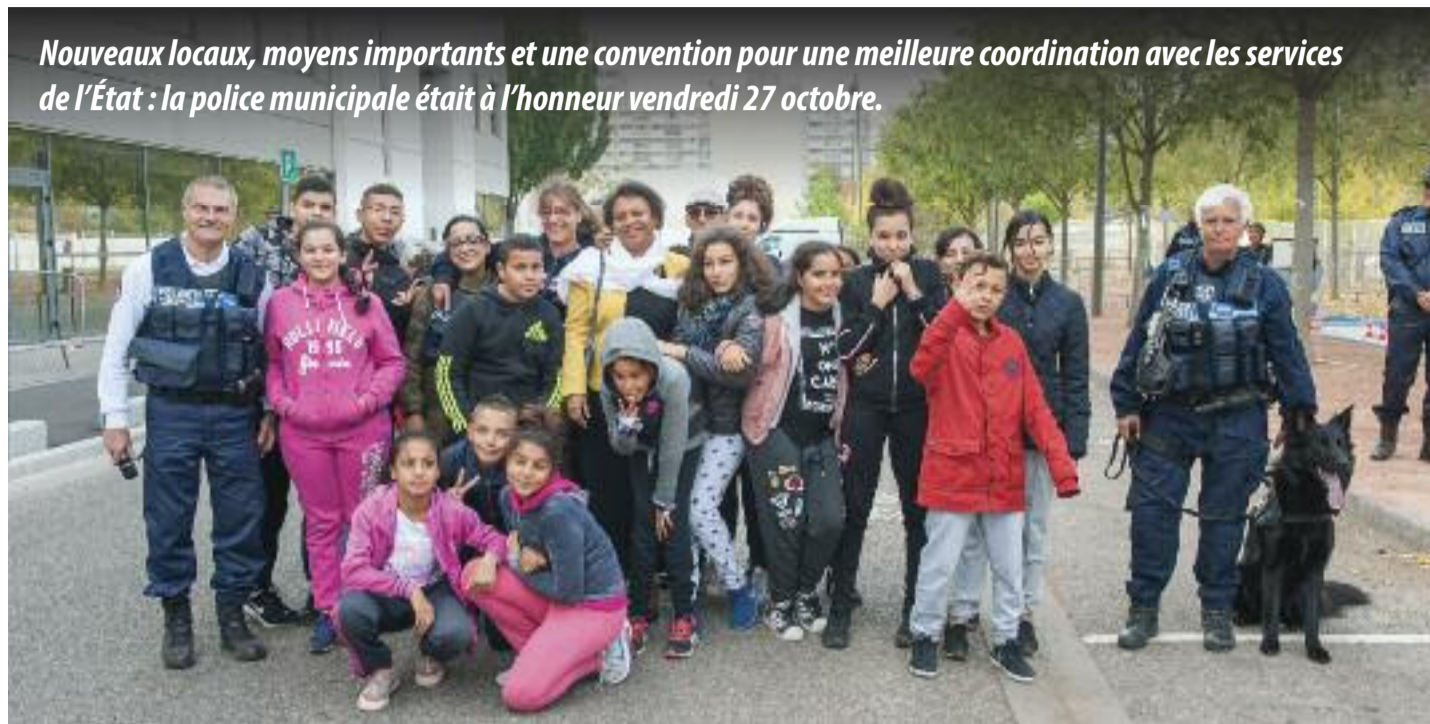
Nouveaux locaux, moyens importants et une convention pour une meilleure coordination avec les services de l’État : la police municipale était à l’honneur vendredi 27 octobre.

La journée a aussi permis aux Vaudais de découvrir les fonctions, métiers et équipements de la police municipale à travers différents stands. Notamment ceux de la brigade canine, VTT ou encore un autre spécialement dédié à la prévention de l’alcool au volant grâce à un simulateur d’ébriété. Les nouveaux véhicules étaient également de sortie. “On est venus voir à quoi ressemblait l’équipement des policiers”, indiquaient Farouk, Idriss et Stéphane, trois adolescents curieux.